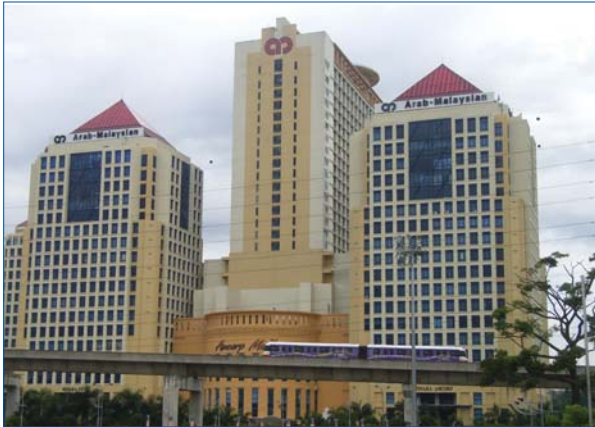
Pejabat Korporat yang baru di Pusat Perdagangan AMCORP