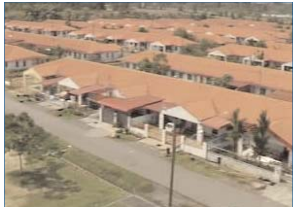
Rumah Teres Satu Tingkat PPP (Perbadanan Pembangunan Perumahan, Sarawak)

Sementara itu, pembangunan Perbandaran Sibujaya telah mencapai kemajuan secara berterusan dengan pelancaran bersama konsep perumahan baru yang dikenali sebagai HDC Garden Terrace pada Februari 2005 bersama-sama dengan Perbadanan Kemajuan Perumahan Sarawak. Sambutan sehingga kini amat menggalakkan.