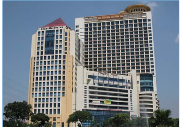
Pemandangan luar suite perkhidmatan

Tahun lepas, saya telah menyebut mengenai pembinaan fasa akhir ATC, yang terdiri daripada 403 unit suite perkhidmatan dan 151 unit suite perniagaan. Fasa akhir ATC ini telah disiapkan tepat pada masa dan, saya dengan sukacitanya melaporkan bahawa kedua-dua suite perniagaan dan suite perkhidmatan telah habis dijual.