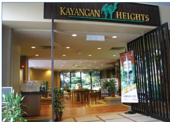
Corporate office of Kayangan Heights in AMCORP Trade Centre, Petaling Jaya

With the completion of the Guthrie Corridor Expressway, Kayangan Heights, our bungalow development project located near an established neighbourhood in Shah Alam, is now easily accessible via all major highways in the Klang Valley. Plans have been formulated to market Kayangan Heights in the form of cluster bungalows and we are optimistic that this concept will be well received.