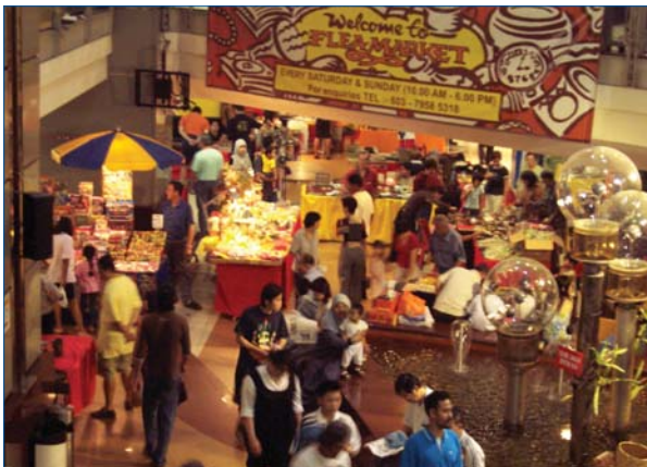
"Flea Market" di AMCORP Mall

Dengan penyiapan projek lebuh raya ekspres Guthrie Koridor, Kayangan Heights, projek pembangunan banglo kami yang terletak berhampiran dengan kawasan kediaman mantap di Shah Alam, kini boleh diakses dengan mudah melalui semua lebuh raya utama di Lembah Klang. Rancangan telah dirumus untuk memasarkan Kayangan Heights dalam bentuk banglo-banglo kelompok dan kami optimistik bahawa konsep ini akan menerima sambutan yang baik.